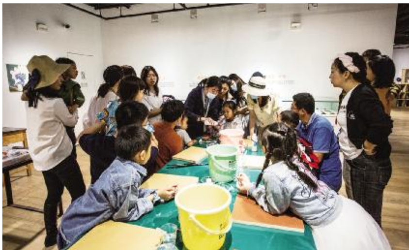
2021 年 4—10 月, 银川当代美术馆开展“重识大地——岩彩艺术体验”活动

【银川当代美术馆】 2021 年, 银川当代美术馆举办“空间幻象——中国装置新一代”“日常的智慧——当代艺术邀请展”“中国共产党成立 100 周年特