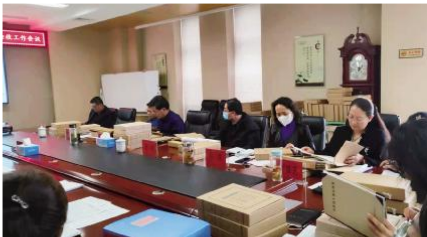
2021年12月8日,银川市档案馆组织人员对馆藏档案第8期数字化加工项目进行验收

好新冠肺炎疫情期间档案资料收集整理的通知》,通过电话、现场指导32家单位,接收23个单位文书档案4613件、专业档案3.38万卷,归档电子文件1284卷、2.89万件。接收银川市社会保险事业管理中心、银川市委组织部人事档案3935卷,长庆石油勘探局有限公司宁榆工业服务处国有企业退休人员人事档案7613卷、实物档案11件。接收18个立档单位的归档电子文件1.31万件,光盘39张,载体容量44.93吉字节(GB)。拍摄和接收重大项目照片624张,收集重要活动照片112张,馆藏图书杂志26本(册)。开放和划控鉴定馆藏93个到期全宗档案3339卷、5.85万件。