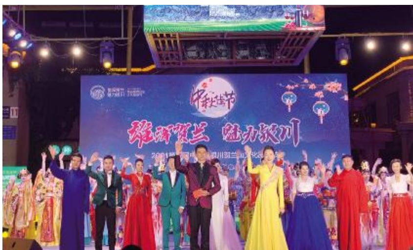
2021 年 9 月 19 日，2021 中国·银川第五届贺兰山文化旅游节在西夏区贺兰山漫葡小镇开幕

【文化助力乡村振兴】 2021 年，银川市以非遗手工文创产品为载体，通过“科技+人才+文化+项目+互联网+培训+农户”运作模式，提升村民收入水平。兴庆区月牙湖乡滨河家园四村、永宁县闽宁镇原隆村建立非遗就业工坊，贺兰县洪广镇广荣村非遗车间组织建档立卡户家庭、留守妇女、老人和残疾人开展就业培训。全年各级非遗传承人在农村举办培训 42 期，培训近千人，帮助 200 余人实现增收，人均月收入约 800 元；在社区举办培训 30 期，培训 1200 余人，帮助近 300 人实现居家创收。培训项目有剪纸、刺