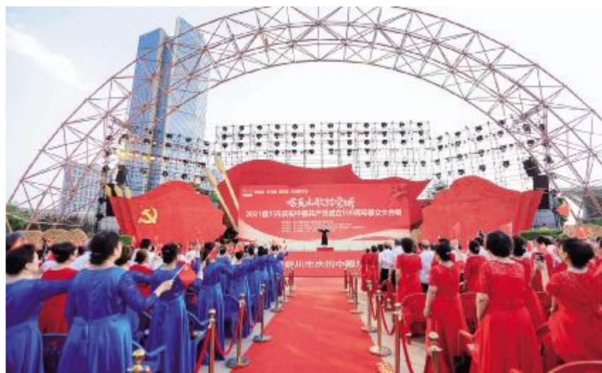
2021 年 6 月 29 日，银川市举办“唱支山歌给党听”2021 银川市庆祝中国共产党成立 100 周年群众大合唱活动

【群众文化活动】 2021 年，银川市文化旅游广电局开展“文化惠民·四送六进”(送演出、送图书、送培训、送电影，进农村、进社区、进校园、进军营、进工地、进特殊教育场所)活动。推行菜单式、订单式服务机制，完成送戏下乡演出 1000 场次、广场文化演出 1000 场次，举办“美丽乡村·文化大集”活动 100 场次、送图书 10 万册(次)，市、县两级参与文化活动团队 100 余支，惠及群众 100 万人次。围绕“我们的节日”主题，开展元旦、春节、清明、五一、端午等系列节庆活动 300 余场次。举办“书香银川”全民阅读推广活动 412 场，其中线下活动 65 场。举办银川秦腔艺术节、戏曲进校园、小戏小品大赛等活动 38 场次。