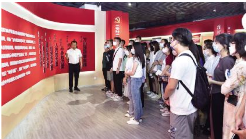
2021年6月9日,银川市档案馆工作人员为“百年恰是风华正茂”主题档案文献展参观人员进行讲解

【爱国主义教育基地作用发挥】 2021年,银川市档案馆结合重要节日和纪念日,与相关部门开展合作,组织市民、机关干部到馆内爱国主义教育基地开