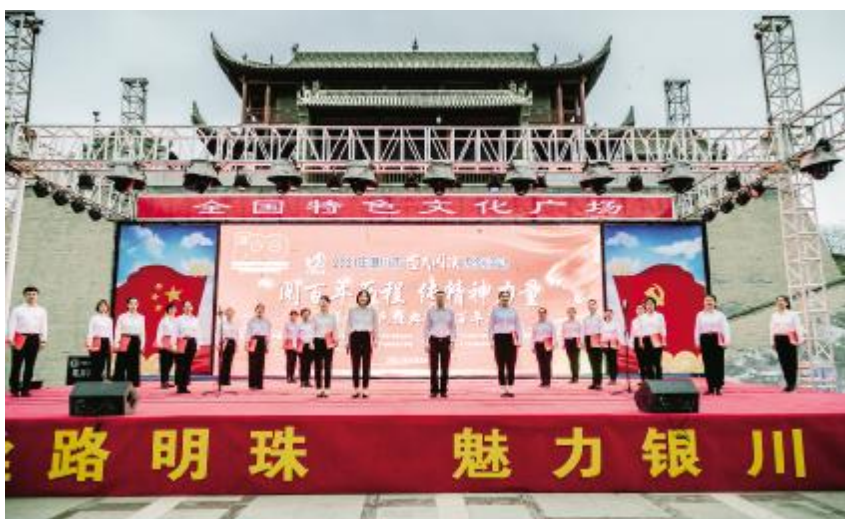
2021年4月22日,银川市图书馆在五皇阁文化广场举办“阅百年历程 传精神力量”诵读红色经典活动

全民阅读活动。2021年,银川市图书馆开展“书香银川·银川书香”全民阅读活动10场,“阅百年历程 传精神力量”2021年银川市全民阅读