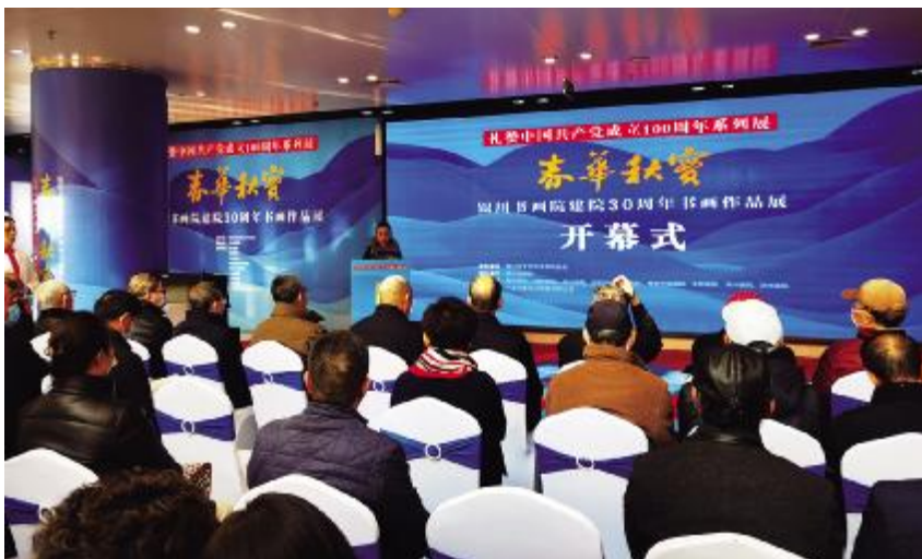
2021年12月23日,银川美术馆举办“春华秋实”银川书画院建院30周年书画作品展

“春华秋实”银川书画院建院30周年书画作品展等,协办银川经济技术开发区成立二十周年“逐浪二十载 扬帆再出发”文学艺术作品展。举办线上“云上幸福年·书画进万家”“宁夏书法名家线上春联展”展览2期,线上公益微课堂2期,线上艺术赏析4期。在兴庆区月牙湖乡滨河家园四村举办麻编技艺培训7期,培训300人次。组织开展麻编扶贫后期合成培训10次。其中,在社区开展下岗女工及退休人员后期合成培训8次、培训160人次;在银川美术馆开展残疾人麻编培训1次、培训24人;在金凤区上海西路街道清水湾社区开展麻编培训1