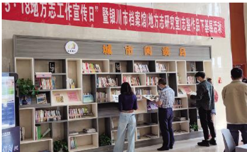
2021 年 5 月 18 日,银川市地方志研究室开展“5·18 宁夏地方志工作宣传日”暨银川市地方志研究室志鉴作品下基层活动

【银川方志馆建设】 2021 年,银川市地方志研究室推进银川方志馆陈列布展进程,组织专家评审布展大纲,