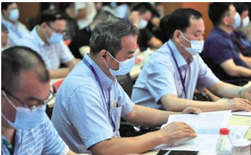
2021年7月30日,中国晚报工作者协会会长会议暨全国晚报社长总编看银川主题采访活动在银川市举办

【《银川晚报》】 2021年,银川市新闻传媒集团所属《银川晚报》完成党的十九届六中全会,全国、自治区、银川市两会等一系列重大报道。开展“庆祝中国共产党成立100周年”报道,开设专栏《奋斗百年路 启航新征程》,设立《学党史、悟思想、办实事、开新局》子栏目。推出特刊《一百年,正青春》,专栏《银川这五年》《牢记嘱托真抓实干、党代会精神在基层》,特刊《银西高铁建成通车及后续》,新春特刊《与光同行》,脱贫攻坚特刊《蜕变——城中村》《山海情,振兴路》,城