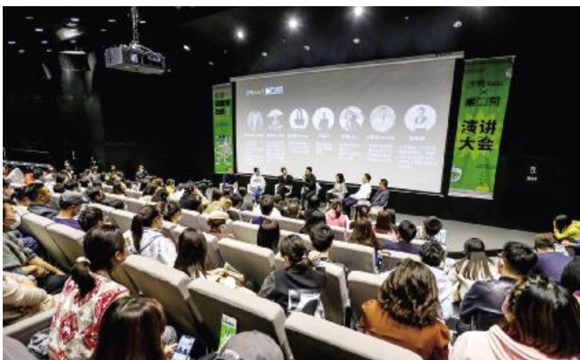
2021 年 10 月 16 日, “沙鸣 Talks”x 银川当代美术馆演讲大会在银川当代美术馆举行