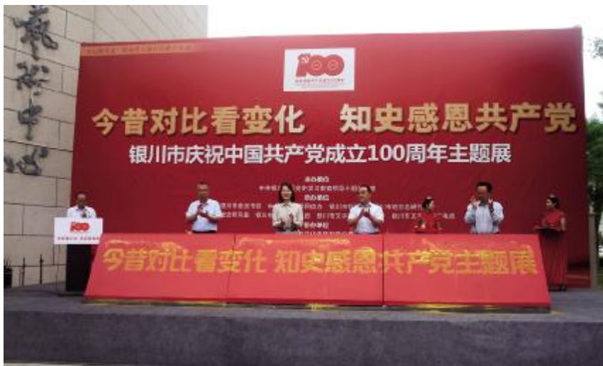
2021年6月11日,“今昔对比看变化 知史感恩共产党”——银川市庆祝中国共产党成立100周年主题展在银川美术馆启幕

【银川美术馆】 2021年,银川美术馆举办各类展览18期,接待观展群众2.65万人次。分别举办以庆祝中国共产党成立100周年为主题的“金牛鼎福”——全国版画名家携青少年小版画作品邀请展、“翰墨丹青颂党恩”书画展、宁夏统一战线“同心圆梦 共书辉煌”书法美术作品展、“千秋伟业 百年辉煌”主题美术创作展、“今昔对比看变化 知史感恩共产党”主题展、“童心向党”小学生绘画大赛暨绘画作品展、“百年筑梦”百名画家作品展、“礼赞百年 银川之光”艺术作品展、