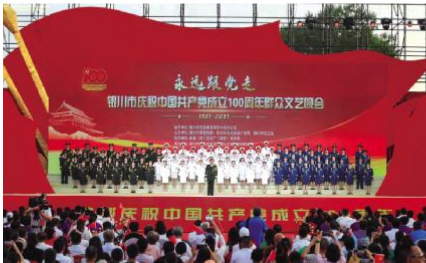
2021年6月30日,“永远跟党走”——银川市庆祝中国共产党成立100周年群众文艺晚会在银川市人民广场举行