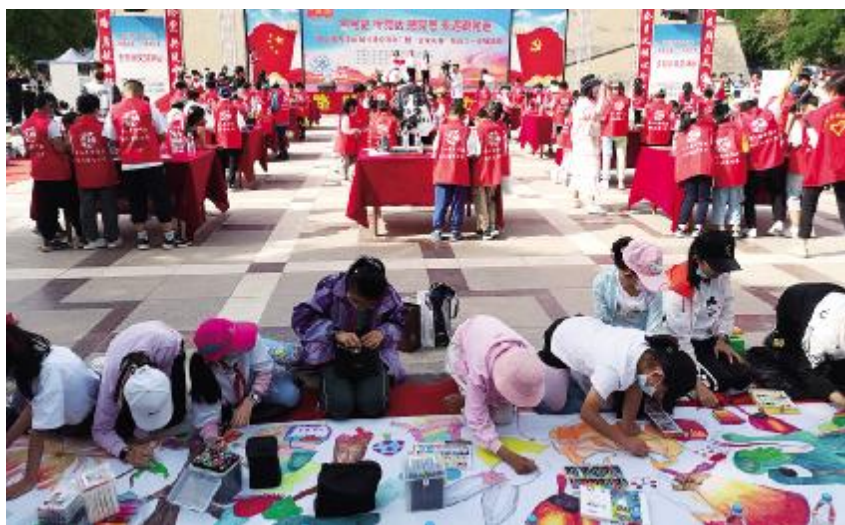
2021年5月29日,银川市图书馆在五皇阁文化广场举办“百人魔方作画 献礼建党百年”暨“百米长卷”绘画六一专场活动