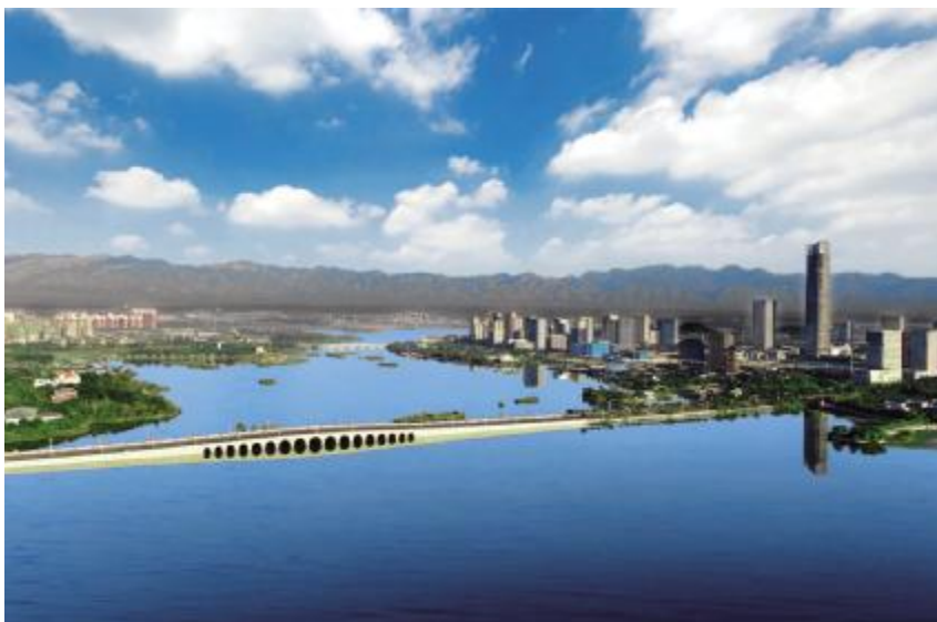
银川市城市湿地景观

【历史沿革】 银川,简称“银”,是国家历史文化名城。三四万年以前,水洞沟旧石器文化遗址是银川地区最早的古人类居民点。殷商、春秋战国时期,这里是北狄、西戎、匈奴等游牧部落的活动地区。秦始皇二十六年(前 221 年),秦灭六国后今银川为北地郡属地。汉元鼎五年(前 112 年),境内所建北典农城(又称“吕城”),为银川建城之始。南北朝时期,成为北方许多游牧部族的居牧地,名曰“饮汗城”。赫连勃勃建大夏国后,改建为“丽子园”,为大夏王的行宫、御花园。北周置怀远郡、怀远县。唐仪凤二年(677 年),怀远县遭黄河水淹,城废。次年在故城西更筑新城(今银川市兴庆区)。宋咸平四年(1001 年),党项族首领李继迁攻占银川平原全境,移总部于灵州。宋天禧四年(1020 年),李继迁之子李德明在怀远镇修建都城,改名“兴州”。后李德明之子李元昊升兴州为兴庆府。宋宝元元年(1038 年),李元昊建立西夏,定都兴庆府。蒙古中统二年(1261 年),以西夏故地建西夏中兴等路行省。元至元二十五年(1288 年),改设宁夏府路行中书省,宁夏之名始于此。明设宁夏镇,下辖七卫,实行军政合一管理,系“九边重镇”之