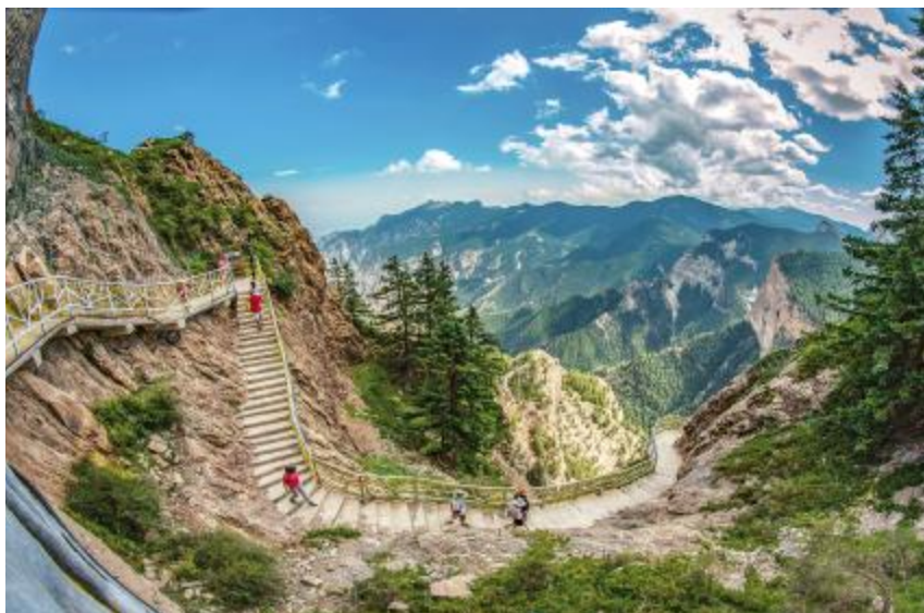
市民在贺兰山国家森林公园游玩

【农业】 2021年，银川市完成农林牧渔业总产值173.20亿元，按可比价格计算，比上年增长5.5%。其中，农业产值87.87亿元，比上年增长1.2%；林业产值1.10亿元，比上年增长93.2%；牧业产值63.51亿元，比上年增长15.5%；渔业产值11.36亿元，比上年增长1.5%；农林牧渔服务业产值9.36亿元，比上年增长4.2%。全年粮食作物播种面积80960公顷，比上年下降0.2%。其中，小麦播种面积6740公顷，比上年下降27.5%。蔬菜播种面积40286.67公顷，园林水果播种面积23720公顷。全年粮食产量70.47万吨，比上年增长1.8%，其中，小麦产量3.85万吨，比上年下降24.7%。蔬菜产量140.86万吨，比上年下降1.2%。园林水果产量17.47万吨，比上年增长73.6%。禽蛋产量2.28万吨，比上年下降17.1%。牛奶产量87.37万吨，比上年增长33.9%。水产品产量7.62万吨，比上年增长0.6%。全年肉类总产量6.19万吨，比上年增长7.4%。其中，猪肉产量1.75万吨，比上年增长11.0%；