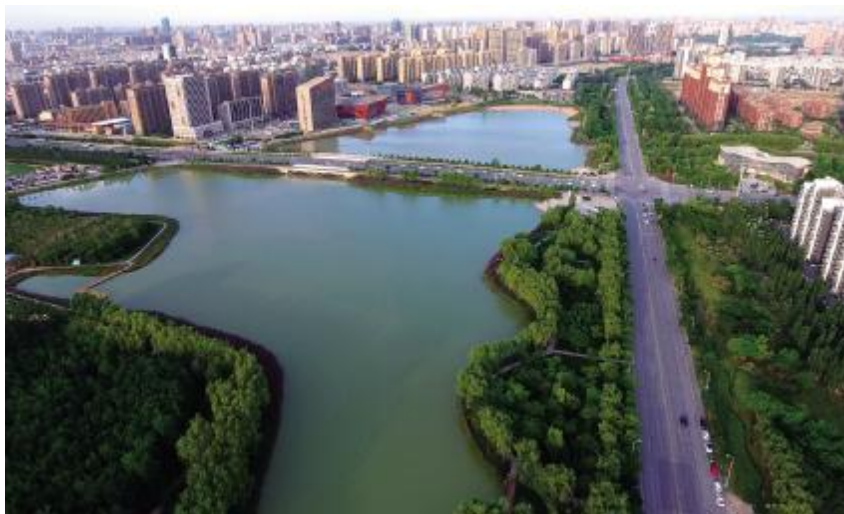
银川市城区风貌(图为华雁湖)

【社会保障】 2021 年年末，银川市参加基本养老保险 152.56 万人，比上年增长 4.3%。其中，参加城镇职工基本养老保险 108.11 万人，参加城乡居民社会养老保险 38.09 万人。参加基本医疗保险 209.42 万人，比上年增长 3.9%。其中，参加城镇职工基本医疗保险 92.25 万人，参加城乡居民基本医疗保险 117.17 万人。参加失业保险 64.79 万人。年末全市拥有各类养老服务机构 41 个，共有床位 9533 张。全市享受城镇居民最低生活保障人数为 1.28 万人，全年发放城镇居民最低生活保障金 0.82 亿元；农村享受最低保障人数 2.16 万人，发放农村最低生活保障金 1.1 亿元。使用城乡医疗救助资金 7346