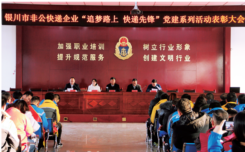
2020年1月17日,银川市邮政管理局举办全市快递行业“先锋快递服务站”和“先锋快递员”表彰大会