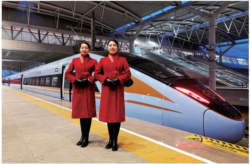
2020年12月26日,银西高铁开通运营

【旅客运输】 2020年,银川车站加强客流组织、候车服务、售票管理、服务质量监督、新冠肺炎疫情防控等工作,推行人性化、差异化、温馨化服务。运用车站“双微”(微信、微博)网络服务平台,为老幼病残孕等重点旅客提供预约服务,“综合服务中心”提供应急改签、问询解答、失物认领、广播找人等便民服务设施。结合电子客票实施,完善旅客进出站组织流线,提供无干扰进站服务。组织成立党团员突击队、先锋队、保障队、服务队28个,坚守新冠肺炎疫情防控关键防线。春运40天,旅客到发量66.28万人;清明节期间,旅客到发量4.3万人;五一小长假期间,旅客到发量12.21万人;端午节期间,旅客到发量8.62万人;暑运62天,旅客到发量157.91万人;中秋节、十一黄金周期间,旅客到发量43.49万人。