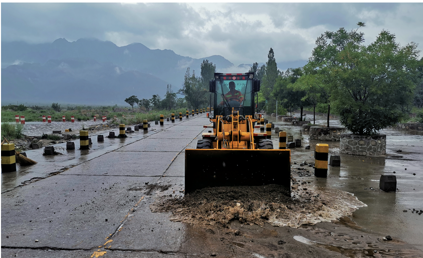
2020年8月23日,银川市公路管理处职工在滚苏岩画公路过水路面处清理山洪堆积物

程碑、百米桩109块,维修路缘石1927米,公路巡查2.9万千米。落实预防性养护常态化,完成路面灌缝4万余延米。提升绿色养护能力,使用沥青混凝土铣刨材料,加大废旧材料利用力度,保护生态环境。提升养护机械化水平,全年采购灌缝机2台,开槽机1台,更换养护车5辆。规划调整农村公路路网,申请将7条乡道、5条村道行政等级提升为县道。加强制度建设和养护技术管理,开展制度、资料专项完善行动。修订养护工程招标管理办法,健全质量保证体系,养护工程质量管理贯穿项目建设始终。实施X104新南公路养护修复工程,完成道路改造1.23千米;实施桥涵维修工程,维修黄羊沟桥、银通路中桥等桥梁锥护坡349.89平方米、铰缝618米,增高涵洞台帽1道;实施千灯万带工程,优化渠化平交道口14处,施划道口标线715.84平方米,增设减速震荡标线540.8平方米,增设标志15块、护栏56米;实施隐患处治工程,整治道路安全隐患点、段8处。开展路域环境综合整治,清理堆积物217立方米,清洗护栏1.5万延米,清洗标志717块,刷新里程碑、百米桩、警示桩5041根,桥涵3072.2平方米。提高公路站绿化水平,清理死树、枯枝和垃圾杂物,补植树木3038棵。