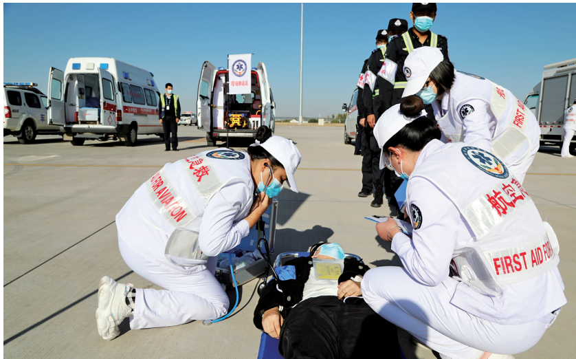
2020年10月22日,西部机场集团宁夏机场有限公司开展银川河东国际机场2020年应急救援综合演练

【新冠肺炎疫情防控】 2020年,西部机场集团宁夏机场有限公司落实“旅客出行防控、一线员工防护、公共区域消杀、染疫航班处置”四个重点,采取出发到达道口100%测温,航站楼、停车楼等公共区域始末毒等严密防控措施,组织防疫党员先锋队26