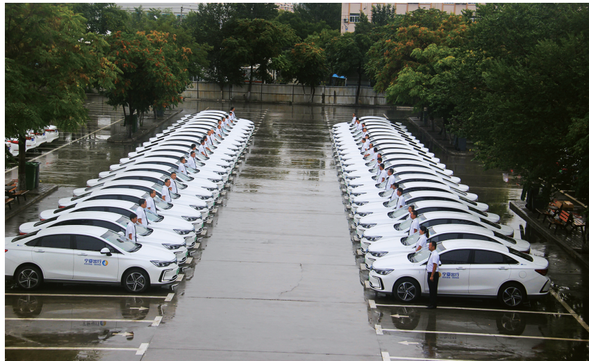
2020 年 9 月 22 日，银川市网络预约出租汽车首发仪式在银川市的士学校举行