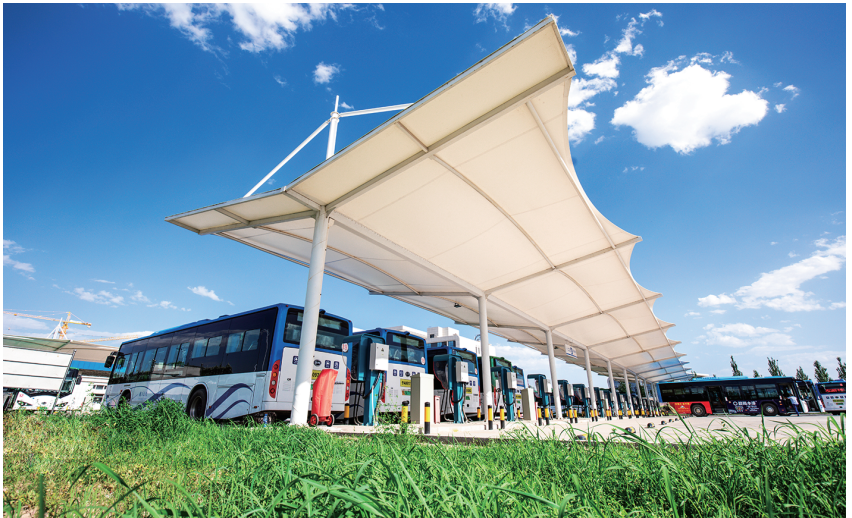
2020 年，银川市公交运营车辆中新能源车辆 615 辆(图为新能源公交车在公交车场充电)

【公共交通服务】 2020 年，银川公交创新服务模式，开通多样化定制服务线路，解决集中时段、特定群体出行。截至年底，开通学生接送专线、企业定制专线、赶集专线、购物专线、早晚快线等公交线路，全年新辟公交线路 18 条，优化调整公交线路 36 条。公交车辆实现全球定位系统(GPS)智能调度，建成城市交通卡收费系统，