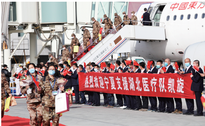
2020年3月20日,银川河东国际机场完成迎接第一批、第三批援鄂医疗队返宁运输保障

支、党员示范岗 39 个。累计体温检测 572.7 万人次,移交高风险地区到宁人员 2.31 万人、境外返宁人员 5168 人,实现人员“零”感染、防护“零”遗漏、工作“零”差错。1月28日至3月25日,银川河东国际机场完成 6 批次 780 名宁夏援鄂医疗队员驰援湖北航班保障任务及 6 批次 785 名宁夏援鄂医疗队员返宁航空运输保障。西部机场集团宁夏机场有限公司运行管理部党总支书记、副总经理盛维君获“全国交通运输系统抗击新冠肺炎疫情先进个人”称号;安检护卫部获“全国交通运输系统抗击新冠肺炎疫情先进集体”称号。西部机场集团宁夏机场有限公司党委被授予“全区抗击新冠肺炎疫情先进基层党组织”称号,机场公司运行管理部医疗急救中心党支部书记、副主任杨明被评为“全区抗击新冠肺炎疫情优秀共产党员”。