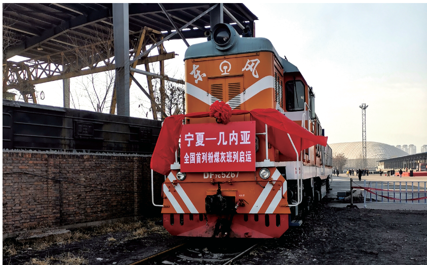
2020年,银川市打造个性化货运产品,开行国际班列31列(图为宁夏一几内亚全国首列粉煤灰班列启运现场)

【概况】 2020年,宁夏民航完成运输起降6.76万架次,实现旅客吞吐量738.6万人次、货邮吞吐量5.28万吨,受新冠肺炎疫情影响比上年分别下降26.3%、34.2%和14.5%。银川河东国际机场三项指标分别完成6.11万架次、690.61万人次、5.18万吨,比上年分别下降27.3%、34.7%和15.4%。月牙湖机场通航飞行完成1.19万架次,比上年下降38%,累计飞行时长4962小时,较上年同期增加4.2%。西部机场集团宁夏机场有限公司坚持保重点、稳航网,挖客源、调结构,保障新冠肺炎疫情期间重点城市不停飞、不断航。为航空公司减免收费930余万元,提前拨付补贴资金5347万元。换季期间加大运力投放,冬季航班计划增长16.7%,银川至三大城市群通航点18个、航线42条。开发航空产品,建成快线4条、准快线10条。推动空铁竞合发展,挖掘铁路沿线潜在客源,银西航班有序运行。截至年底,银川河东国际机场旅客吞吐量恢复至2019年的65.3%。银川河东国际机场首次获得国际机场协会(ACI)“最佳环境和氛围奖”“最佳旅客服务奖”。